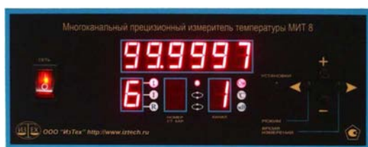
МИТ 8.02 – МИТ 8.10

На лицевой панели приборов МИТ 8.02 – МИТ 8.10 расположены: дисплей, клавиши управления и тумблер включения питания (рис. 2). На лицевой панели приборов МИТ 8.10М, МИТ 8.10М1, МИТ 8.15 расположены: дисплей и две ручки управления (рис. 3).