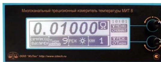
МИТ 8.10М, МИТ 8.10М1, МИТ 8.15